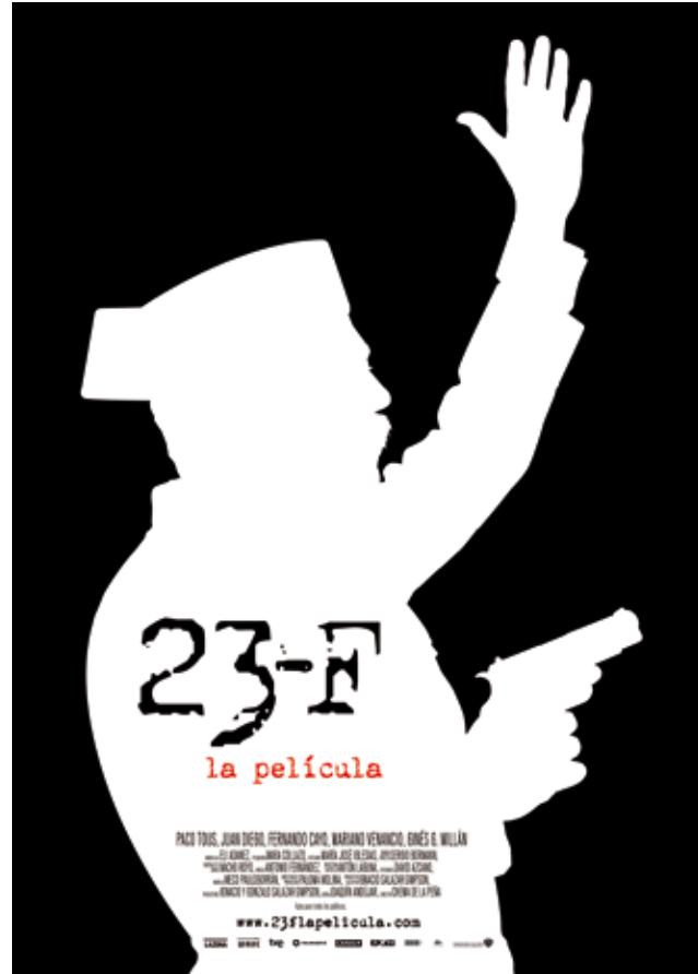
Cartel “23-F: La película”

Con motivo del aniversario del golpe de Estado de 23 de febrero de 1981 la Fundación realizó en el Instituto Internacional una proyección seguida de coloquio del largometraje 23F dirigida por el realizador José María de la Peña, que participó en el debate posterior junto al productor Ignacio Salazar-Simpson.