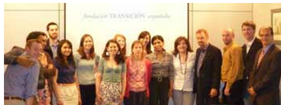
Grupo de alumnos de Bentley University .