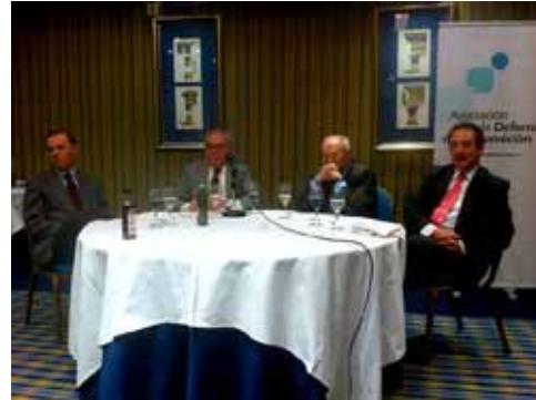
Izq: Encuentro con MAS Consulting