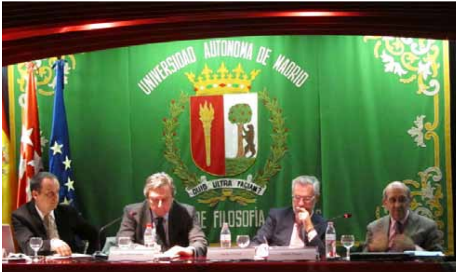
Participantes en el Congreso Internacional de Historia del Partido Socialista España: 1982-1996.