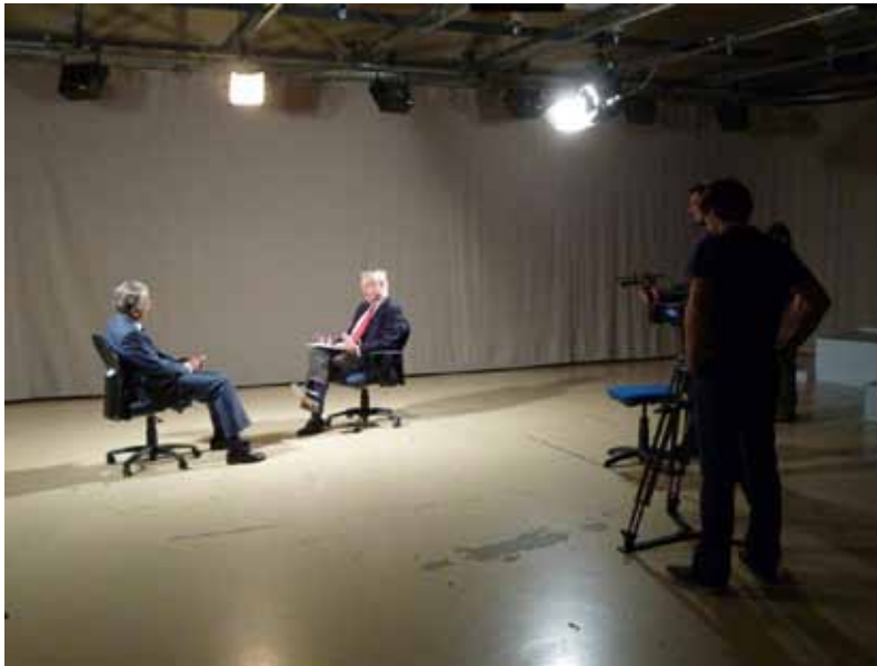
Sesión de grabación en el estudio de la URJC.