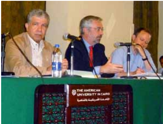
Seminario en The American University in Cairo .