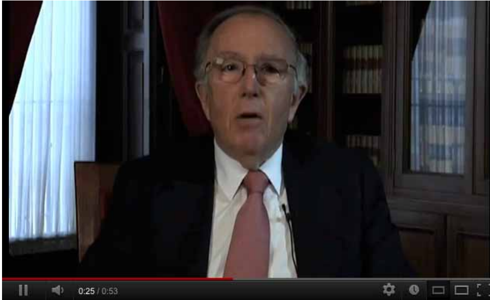
Grabación del testimonio de Marcelino Oreja (Ministro de Exteriores 1976-80).

Asimismo abrimos página web en Facebook y Twitter .